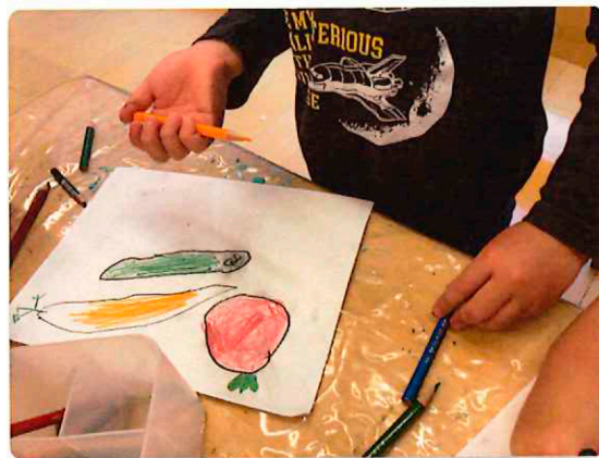
「カリフラワーもしてるよ!」