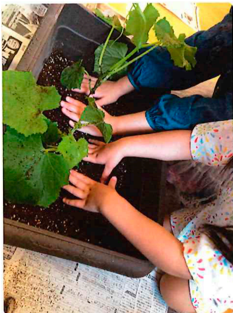
「おおきなあれ! おいしくなあれ!」