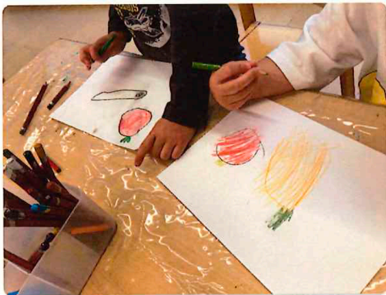
「にんじんはほそながくてオレンジだよね」

最初にみんなが知っている野菜を描いてもらい、描いた野菜を 「土の下で育つ野菜、土の上で育つ野菜、木で育つ野菜」の3種類に分類しました。